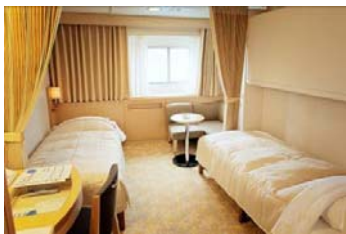
コンフォートステート