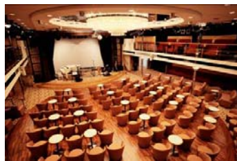
ドルフィンホール