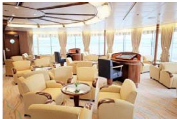
ホライズンラウンジ