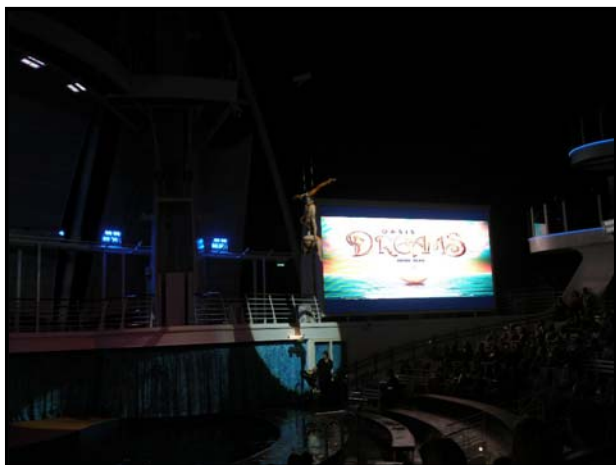
▲ワイヤーで吊られながらの演出も