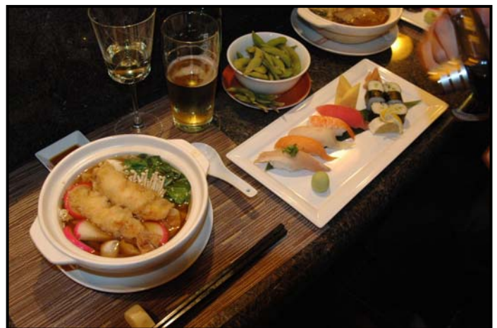
▲こちらの鍋焼きうどんの他にすき焼きもあります

それと、処女航海での本番に先立ち、「オアシス・オブ・ドリームス」の“リハーサル”がショーとして公開されました。その様子を少しだけご紹介いたします。