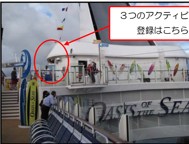
3つのアクティビティの 登録はこちらで