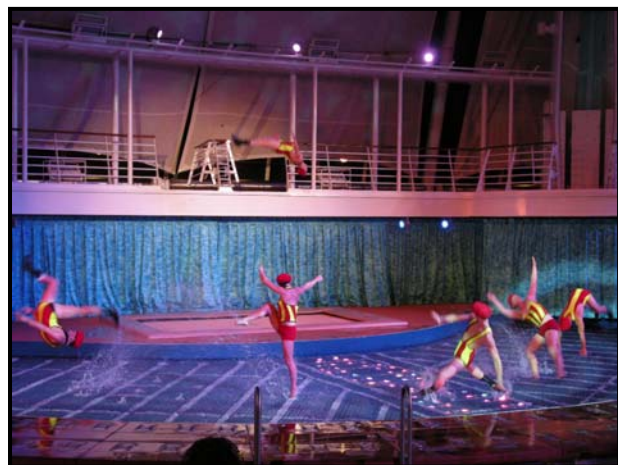
▲ステージ上でキャストが縦横無尽に

キャストが演出する、ダイビングあり、アクロバティックありの派手なショーのあとに、噴水のショーが行われました。音楽に合わせて、強弱をつけた水の噴出もなかなかの迫力でした。(注：前方の席は濡れます！)