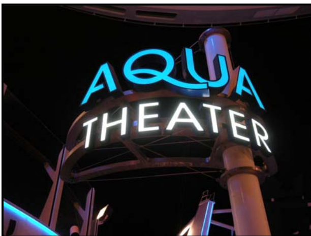
▲会場はもちろん「アクア・シアター」

それと、処女航海での本番に先立ち、「オアシス・オブ・ドリームス」の“リハーサル”がショーとして公開されました。その様子を少しだけご紹介いたします。