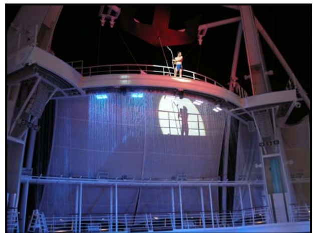
▲幕開けは、高台での主役の登場