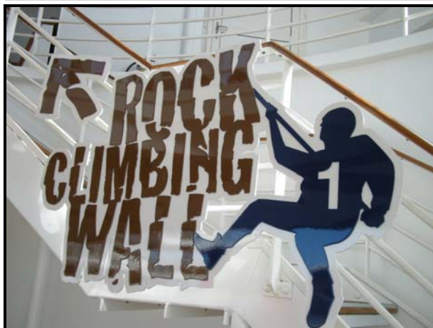
▲お馴染みの「ロッククライミング」ですが…