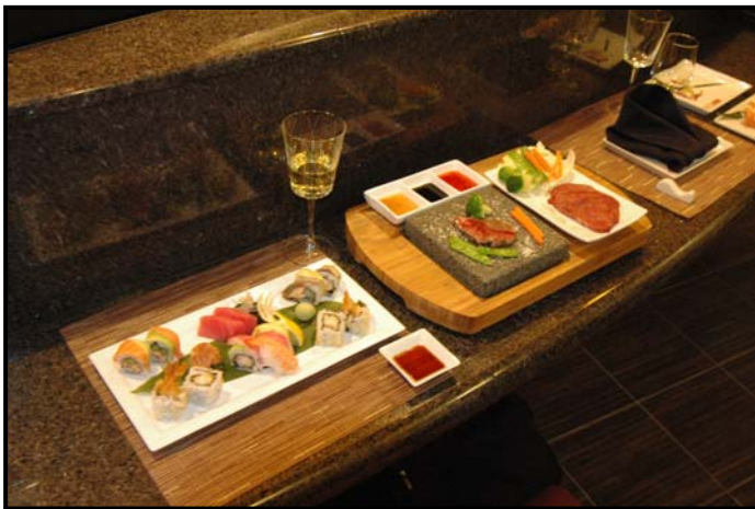
▲もちろんお寿司もあります

*スペシャルティ・レストランについて 『オアシス・オブ・ザ・シーズ』には、メインダイニングの他に様々なダイニング・オプションがございます。なかでも有料のスペシャルティ・レストランは、いずれも個性豊かでクルーズを演出するのに一役買ってくれること、間違いなしです！ デッキ8のセントラル・パークにいくつか並んでおり、夜になると、ちょっとオシャレな雰囲気の中で“外食”をお楽しみいただけます。 また、和食が恋しくなったら、「いずみ」へどうぞ！