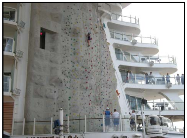
▲こんなに高い！！（右側はスイートの一角）