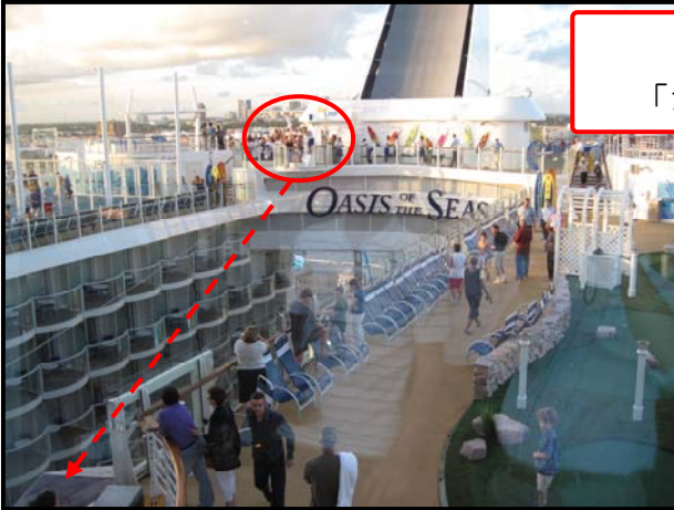
スリル満点 「ジップ・ライン」

船上からの最後のレポートは、“アクティブ”なポイントをご紹介します。いずれも、船尾のゾーンにあります「ジップ・ライン」、「フローライダー」、そして「ロッククライミング」です。いずれも、デッキ16の船尾のカウンターで事前登録・予約をしていただく必要があります。『オアシス・オブ・ザ・シーズ』のスケールの大きさを文字通り“肌で感じる”ことのできるおすすめアクティビティです！！他の客船では味わうことのできない体験をぜひご自身でお確かめください。