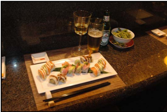
▲カリフォルニア・ロールに、枝豆とビール

せっかくなので、有料のスペシャルティ・レストランをひとつご紹介いたします。 日本食をお召し上がりいただける「Izumi」（いずみ）です。アラカルト料金となっています。